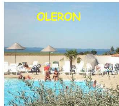
OLERON Mobil home - 4/6 pers Promo du 27 juin au 01 août