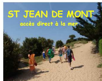
ST JEAN DE MONT accès direct à la mer Chalet 5 et 6 pers Promo du 27 juin au 01 août