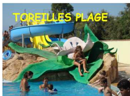
TOREILLES PLAGE Mobil home - 4/6 pers et 6 pers Promo du 27 juin au 01 août