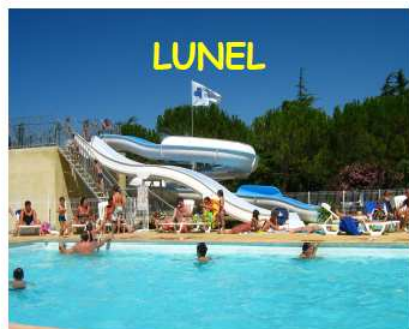
LUNEL Mobil home - 4/5 pers Chalet 6 pers Promo du 27 juin au 01 août