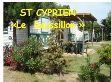
ST CYPRIEN «Le Roussillon» Chalet 6 pers Promo du 27 juin au 01 août

Offres non rétroactives aux réservations passées avant le 1 juin 2009, et non cumulables avec une autre réduction.