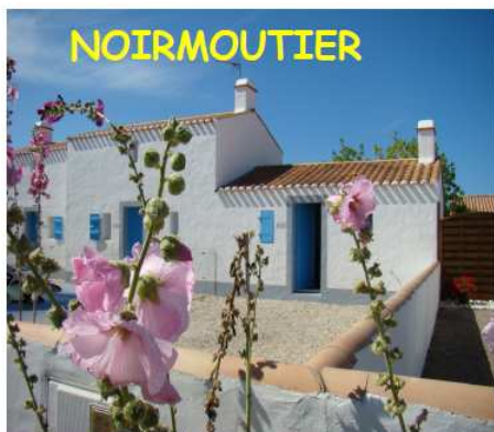
NOIRMOUTIER Villas T1 - T2 - T3 de 2 à 9 pers Promo du 27 juin au 01 août