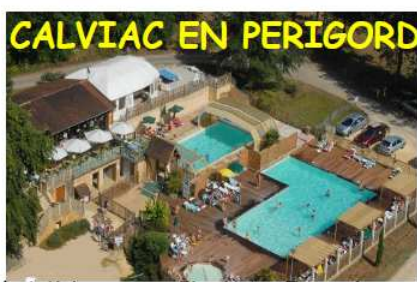
CALVIAC EN PERIGORD Mobil home - Chalets 5 et 6 pers Promo du 27 juin au 01 août

Promo séjour 2 semaines 15 % : code CL2JUIL09