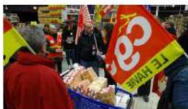
Des chariots remplis de produits et des salariés sacrifiés dit la CGT Photo : Image DSC00106.jpg (19719696)

Après avoir multiplié les actions dans les points de vente proches du Havre, les Sidel sont sortis de leur point de Caux pour aller porter le combat près de Rouen.