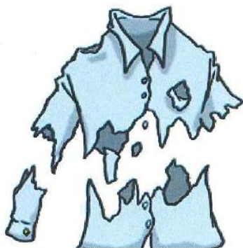
CHEMISE EN TISSU