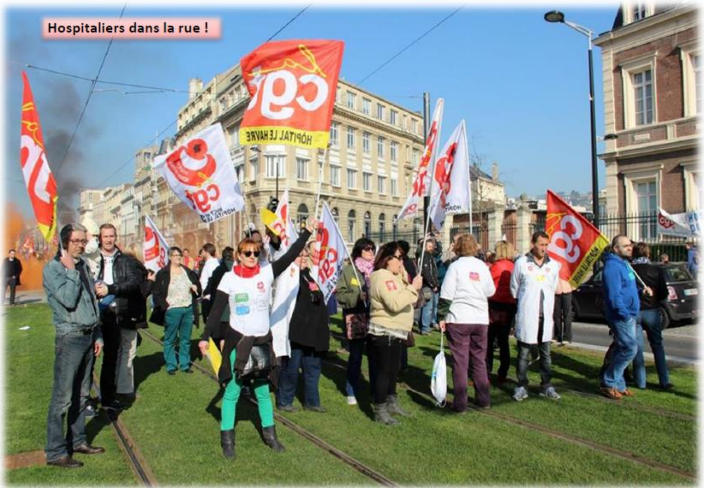
Hospitaliers dans la rue !