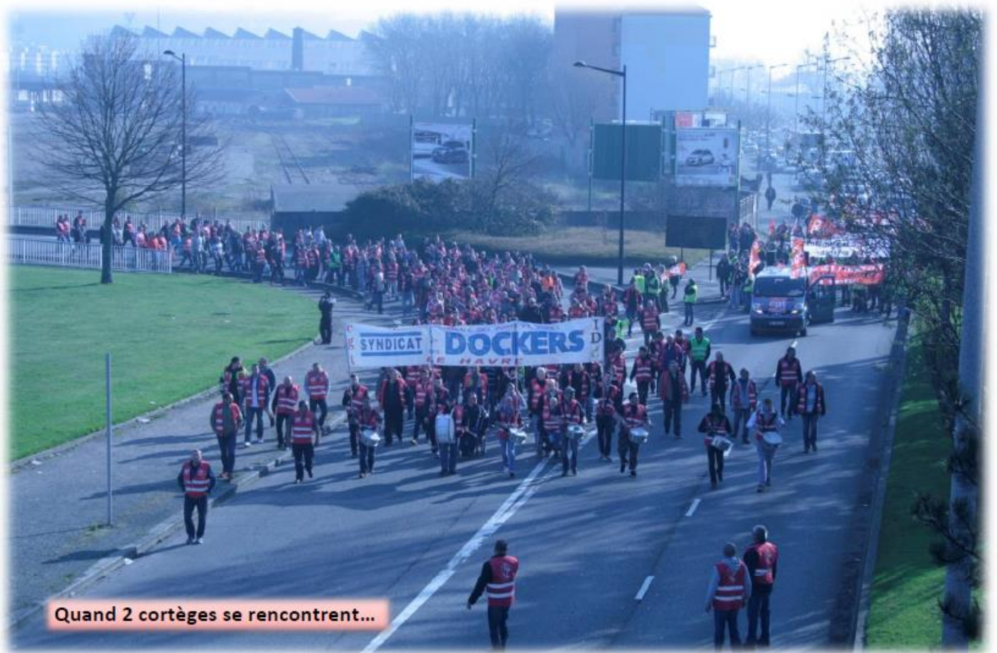
Quand 2 cortèges se rencontrent...