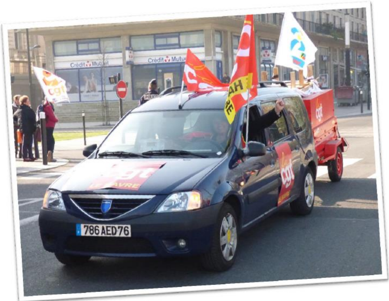
Renault, Dacia, même combat !