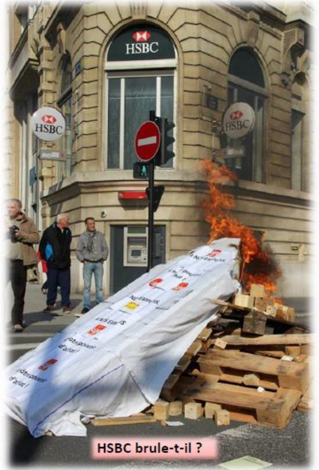
HSBC brule-t-il ?