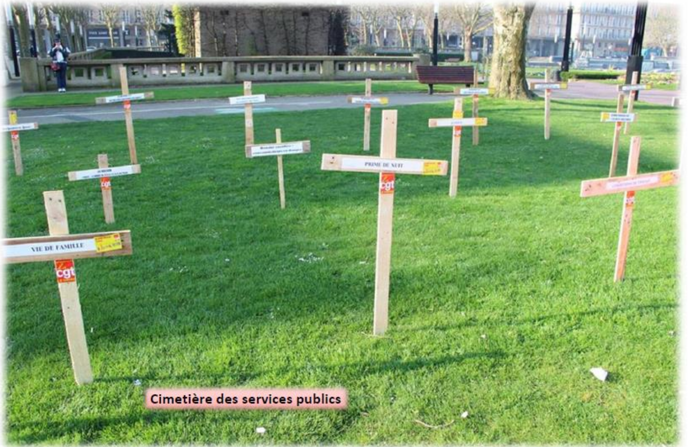
Cimetière des services publics