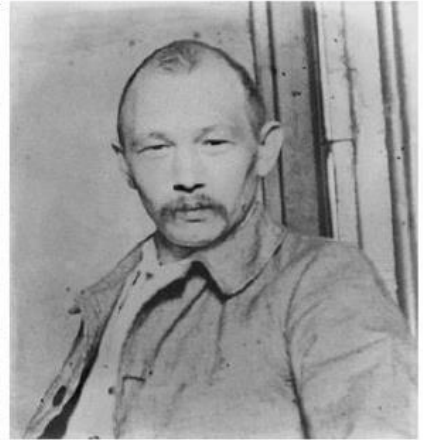
Jules Durand, 1912, deux ans après sa condamnation, à l'Asile de Sotteville les Rouen

L'Union des syndicats CGT du Havre vous convie à la commémoration le vendredi 11 septembre 2015 à 11h, à la maison des syndicats.