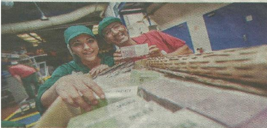
es produits de la coopérative seront dans un premier temps vendus chez Auchan.